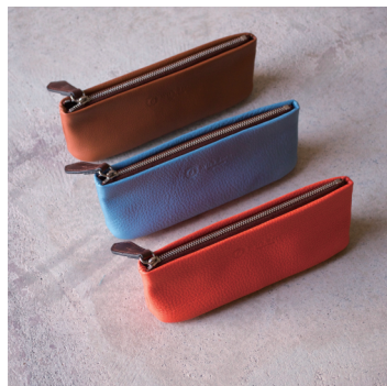
ポーチ S ¥4,300