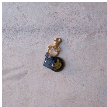
フレブルキーホルダー プニプニ付 ¥2,400