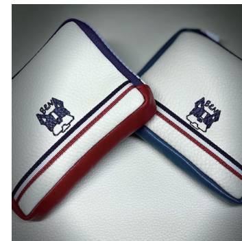
フレブル角ポーチ ¥2,500