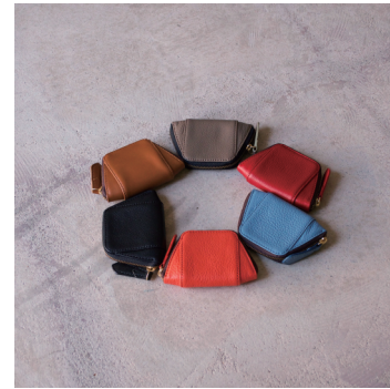
シェル型コインケース ¥4,500