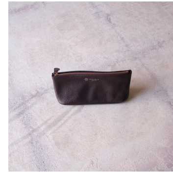
ポーチ L ¥6,500