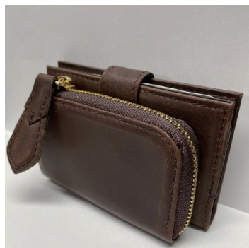
ミニマムウォレット L ¥12,700