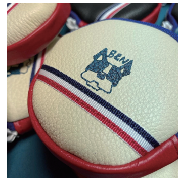
フレブル丸ポーチ ¥2,000